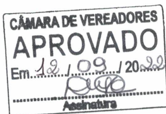
ADAIR BORGES MODEL